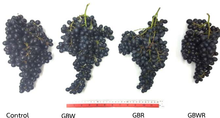
Figure 3 Characteristics of Beauty Seedless grape cluster on different trunk girdling (Control = without girdling, GBW = girdling before yielding in winter (November 18 th , 2016 and November 10 th , 2017), GBR = girdling before yielding in rainy season (May 19 th , 2017), GBWR = girdling before yielding in winter and rainy season (November 18 th , 2016, May 19 th , 2017 and November 10 th , 2017)), harvest on December 22 nd , 2017.

Note: ns = non significant, control = without girdling, GBW = girdling before yielding in winter (November 18 th , 2016 and November 10 th , 2017), GBR = girdling before yielding in rainy season (May 19 th , 2017), GBWR = girdling before yielding in winter and rainy season (November 18 th , 2016, May 19 th , 2017 and November 10 th , 2017)