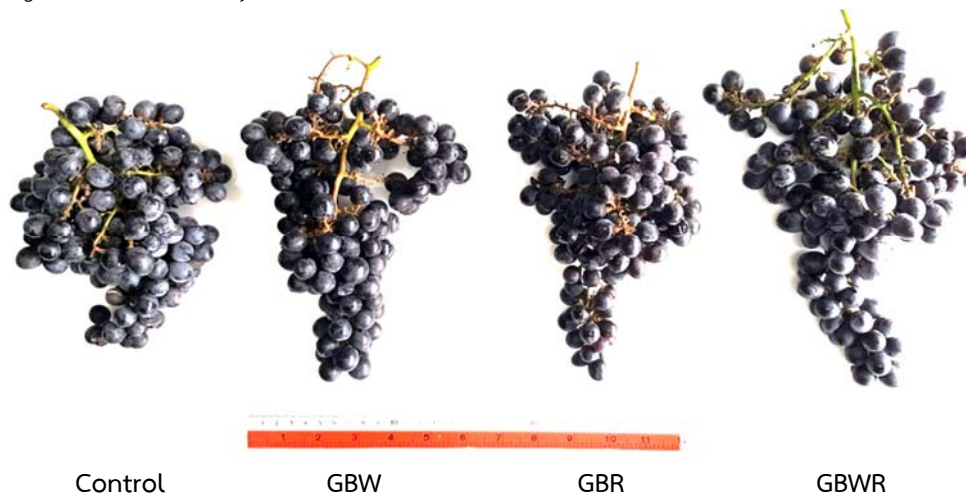
Figure 1 Characteristics of Beauty Seedless grape cluster on different trunk girdling (control = without girdling, GBW = girdling before yielding in winter (November 18 th , 2016), GBR = girdling before yielding in rainy season (without Girdling), GBWR = girdling before yielding in winter and rainy (November 18 th , 2016)), Harvest on January 6 th , 2017.

ns = non significant, control = without girdling, GBW = girdling before yielding in winter (November 18 th , 2016), GBR = girdling before yielding in rainy season (without Girdling), GBWR = girdling before yielding in winter and rainy (November 18 th , 2016)